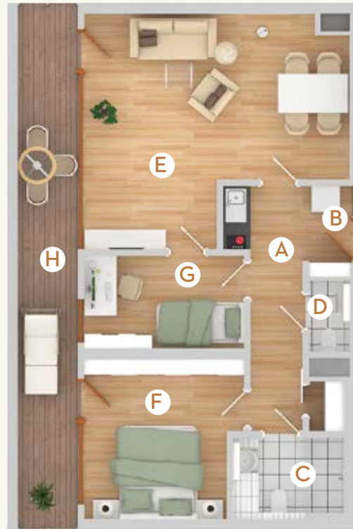
Typ C1 | 77,5 m 2