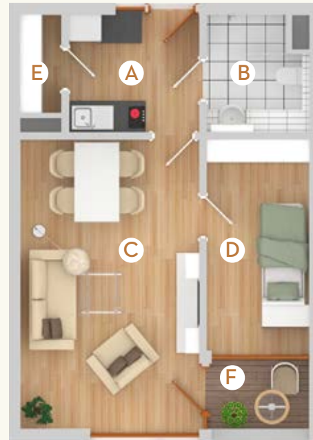
Typ B2 | 43 m 2