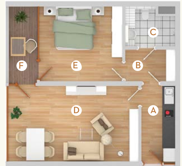
Typ B6 | 58 m 2