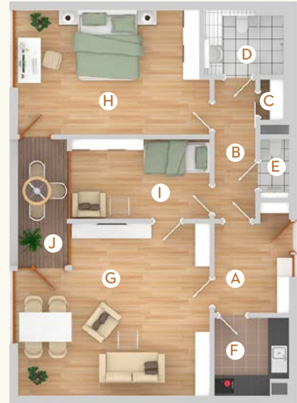
Typ C4 | 88 m 2