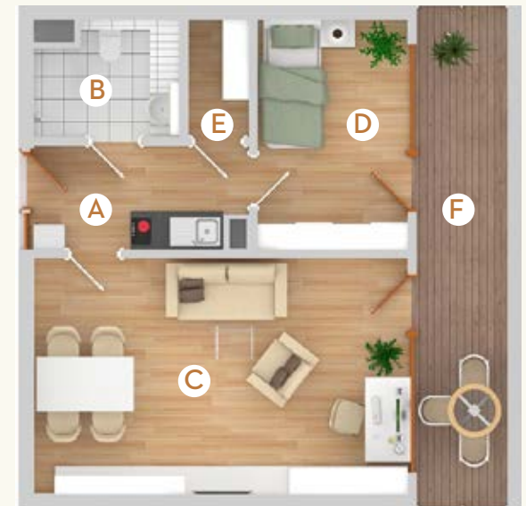
Typ B3 | 51 m 2