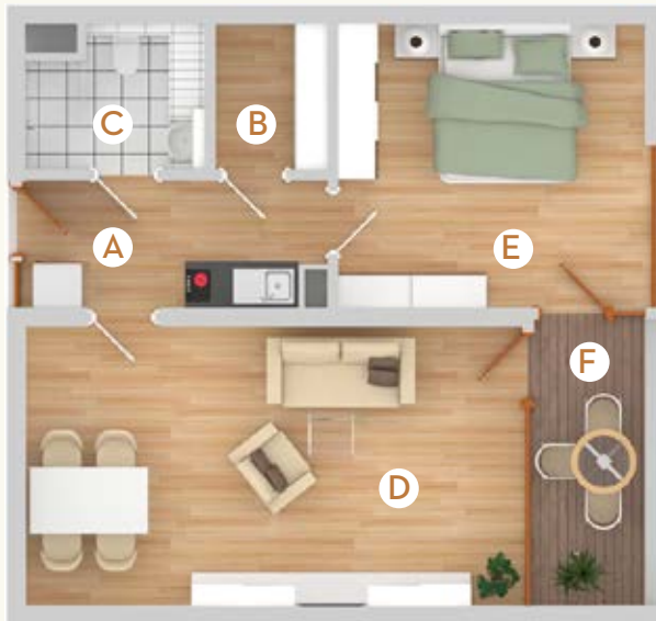
Typ B7 | 58 m 2