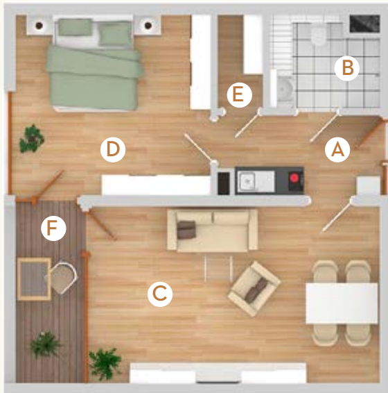
Typ B4 | 54 m 2