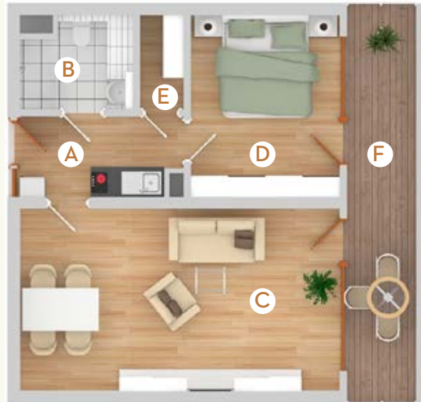
Typ B5 | 55 m 2