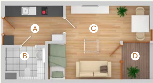
Typ A | 32 m 2